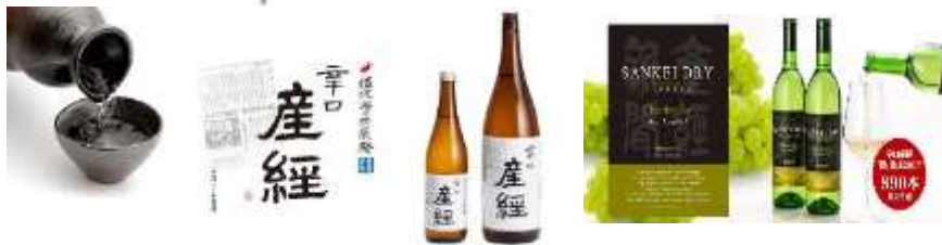
佐渡の酒蔵とコラボしたオリジナル日本酒を開発・販売