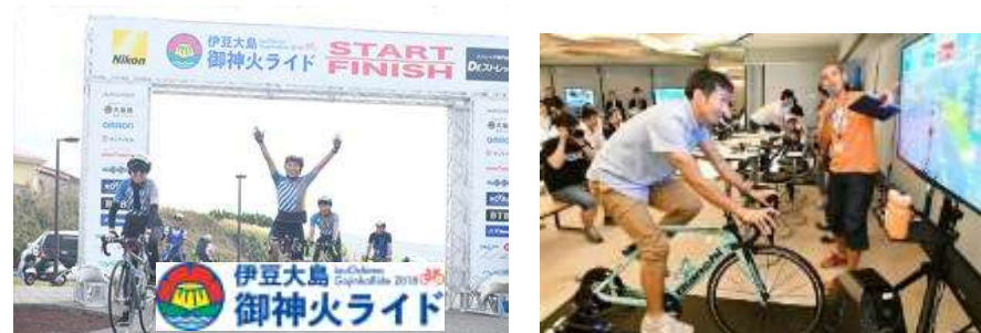
伊豆大島の活性化を目的としたサイクリングイベントを開催

自治体様と連携 したサイクリングイベントを開催。 オンライン/オフラインイベントの企画・運営から プロモーションまでワンストップで実施が可能。