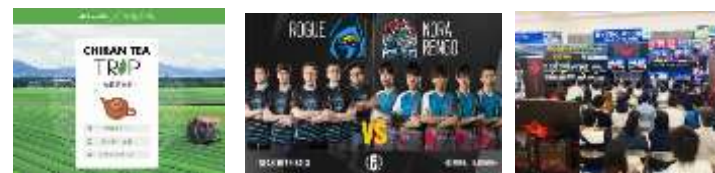
南九州市の知覧茶を産経デジタルがプロモーションサポート

自治体様の 物産品 のプロモーションや 企業様の eスポーツ シーン参入のサポートなど 多岐に渡ったコンサルティングを行っています。