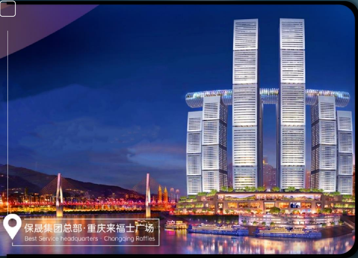
保晟集团总部·重庆来福士广场 Best Service headquarters · Chongqing Raffles